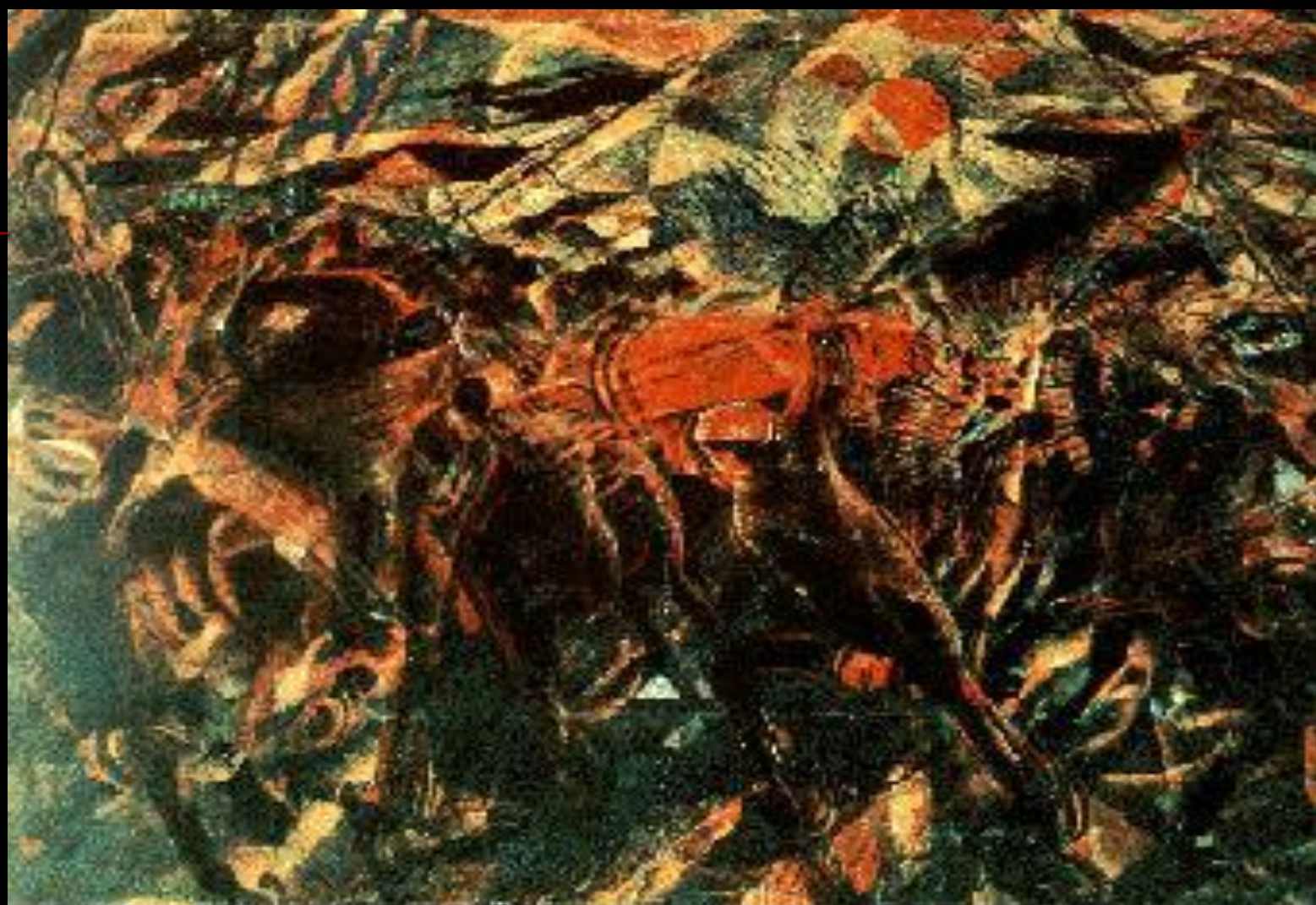
Funerais do anarquista Galli, Carlo Carrá, MOMA, Nova York