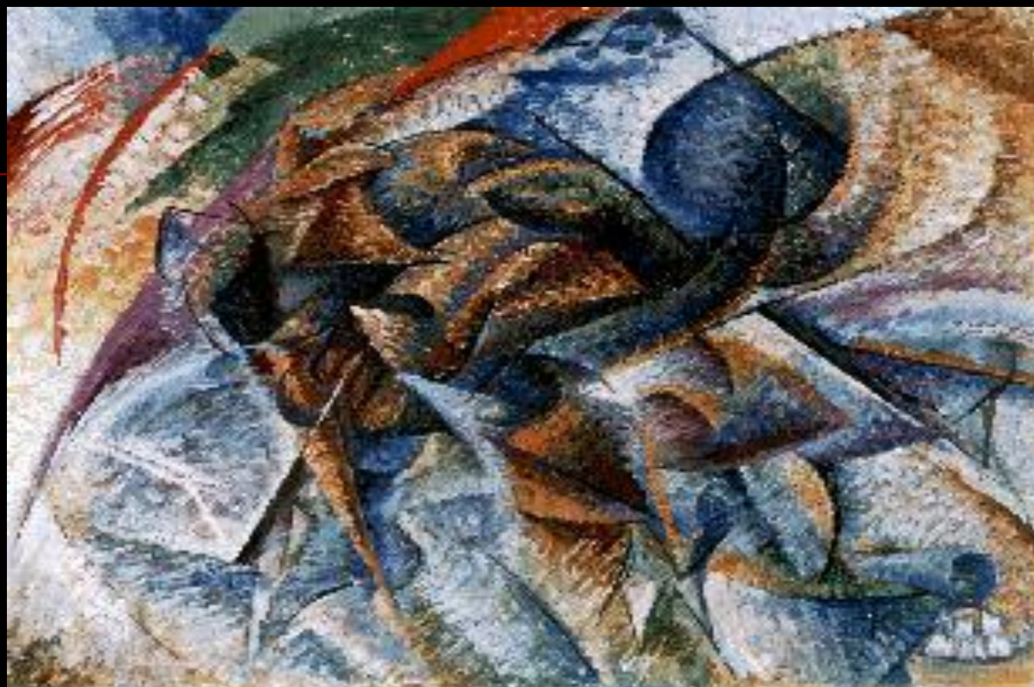
Dinamismo de um ciclista, Umberto Boccioni, Coleção Mattioli, Milão