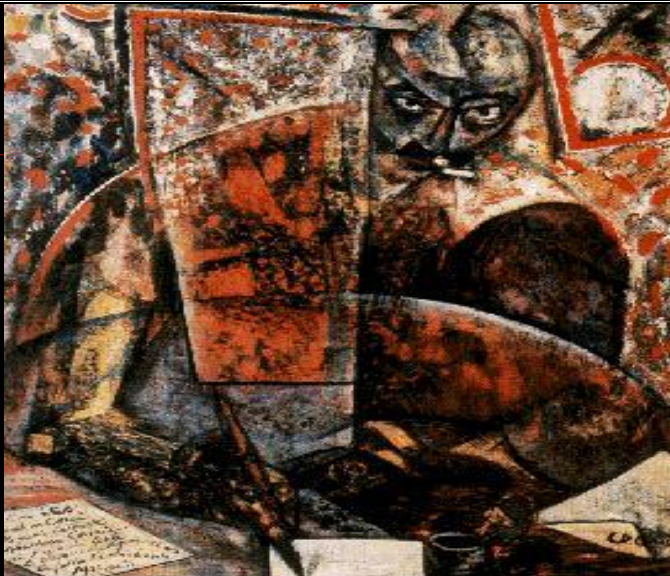
Retrato de Marinetti, Carlo Carrá, Col. Particular