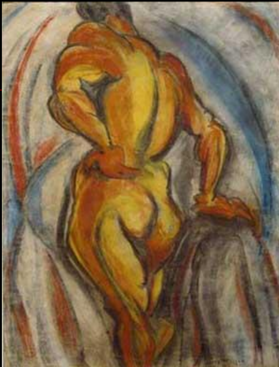
■ Torso/Ritmo , c. 1915/ 1916 carvão e pastel s/ papel, 61 x 46,6 cm