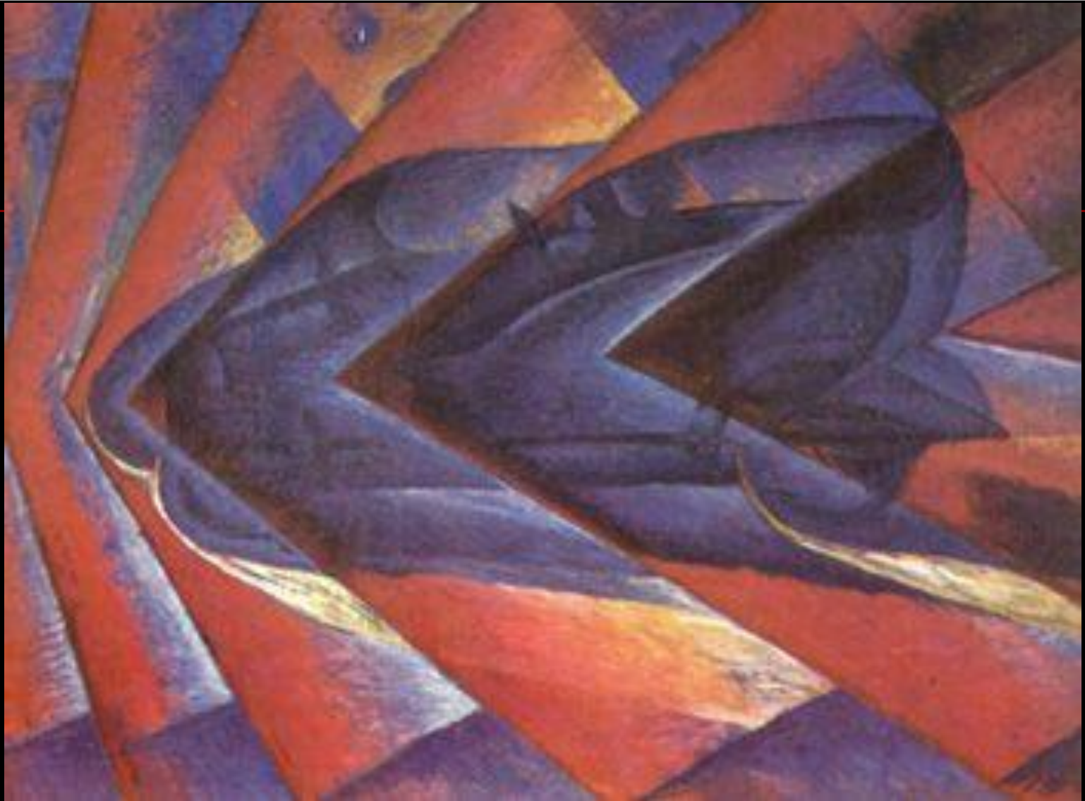
Luigi Russolo Dinamismo de Um Automóvel, (1911)