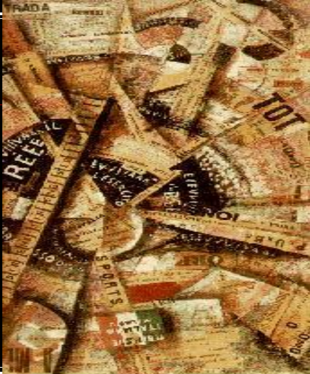
Manifestação Intervencionista, Carlo Carrá, Col. Particular