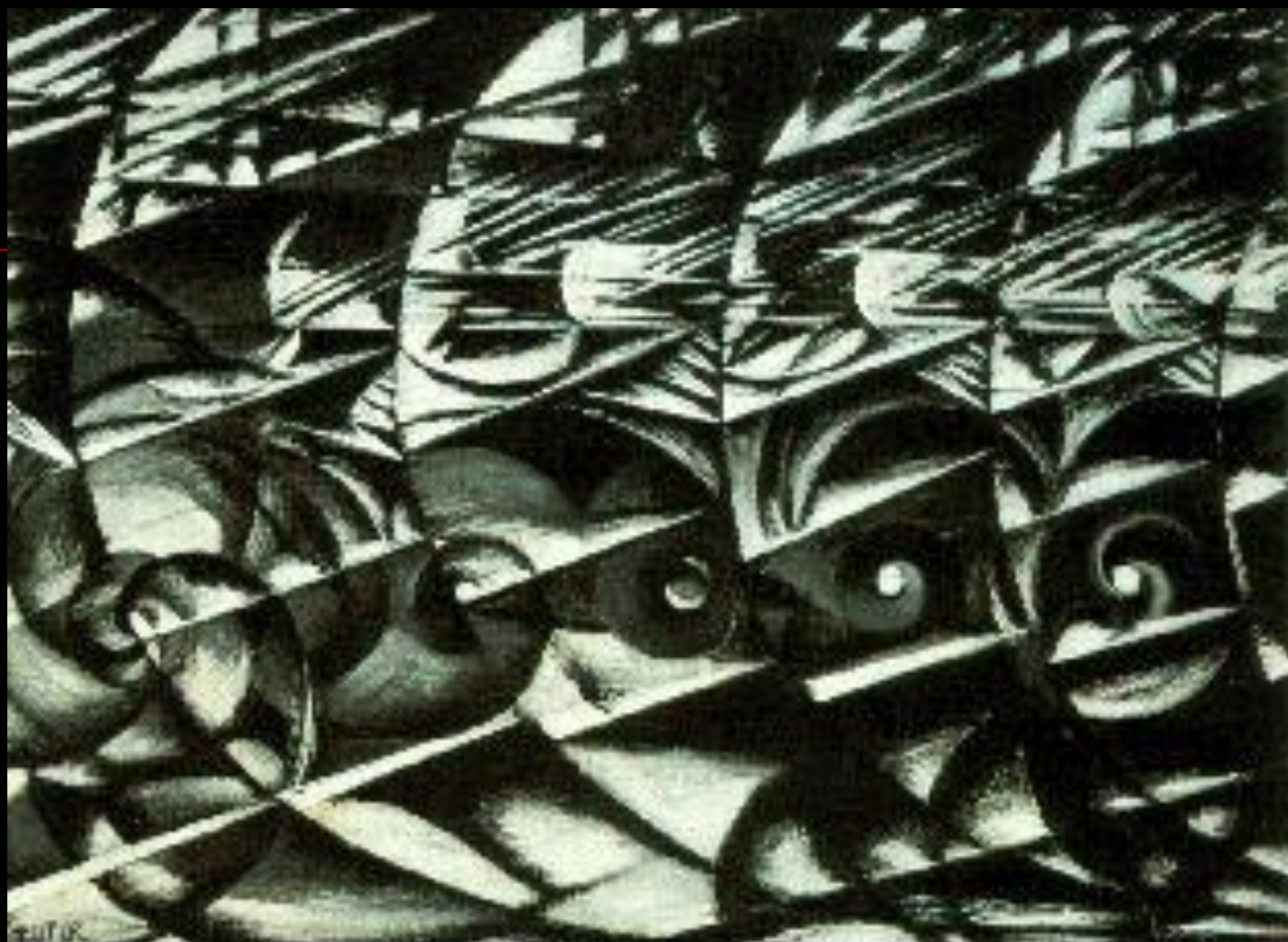
Velocidade Abstrata - O carro passou, Giacomo Balla, Coleção Particular