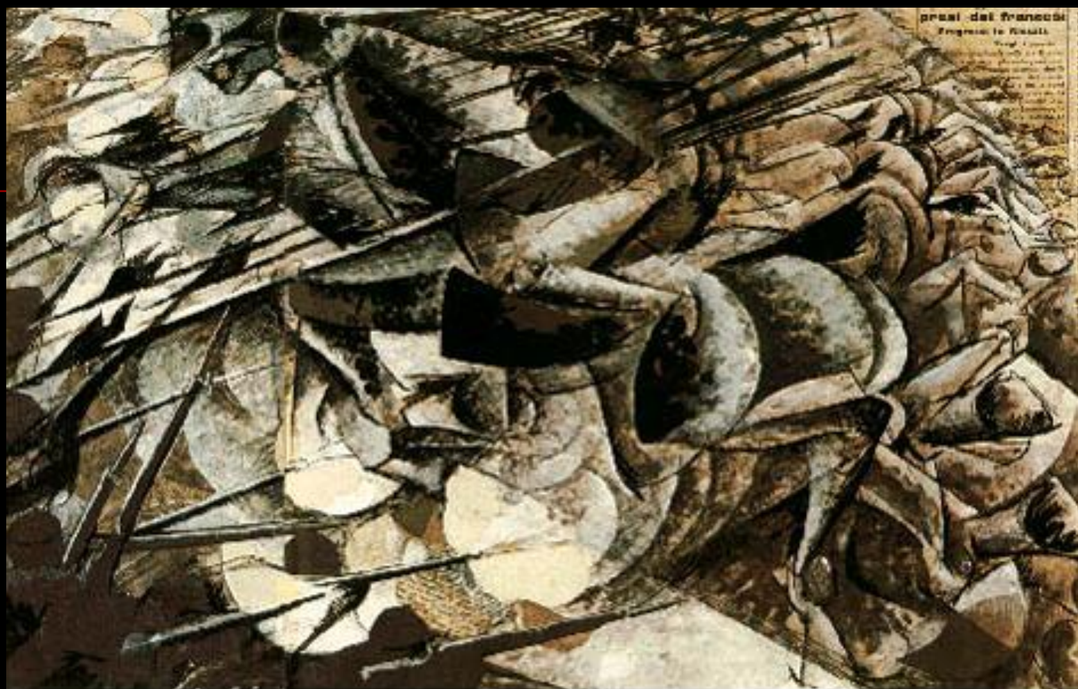
A carga dos lanceiros - Umberto Boccioni Coleção Jucker, Milão - (XX)