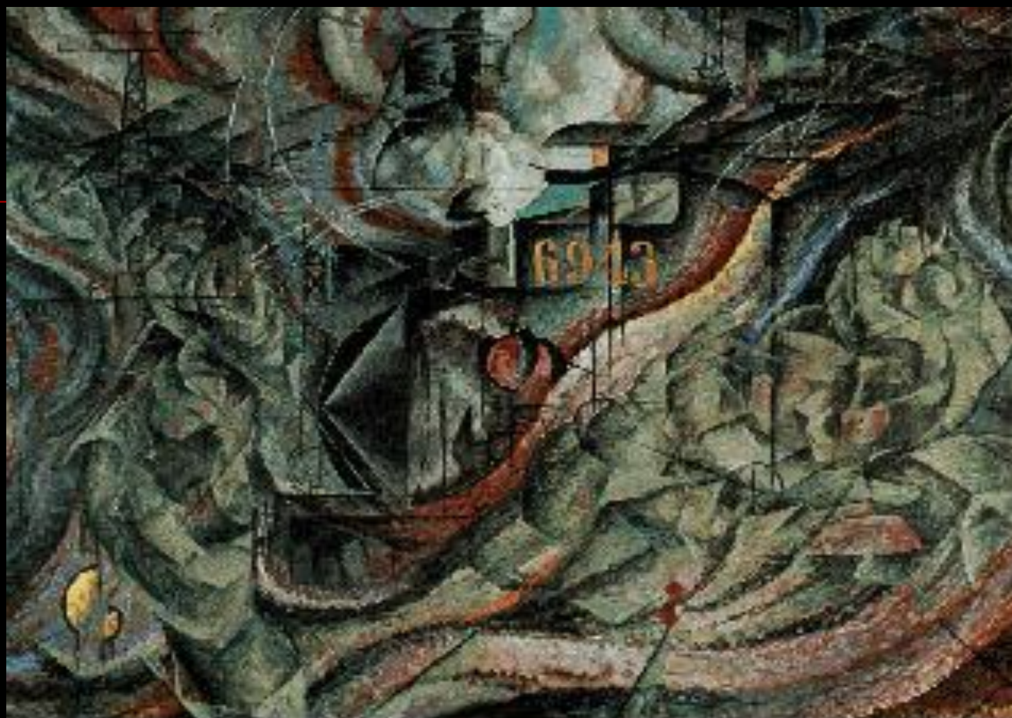
Estado de ânimo II - Os adeuses, Umberto Boccioni, Museu de Arte Moderna, Nova York