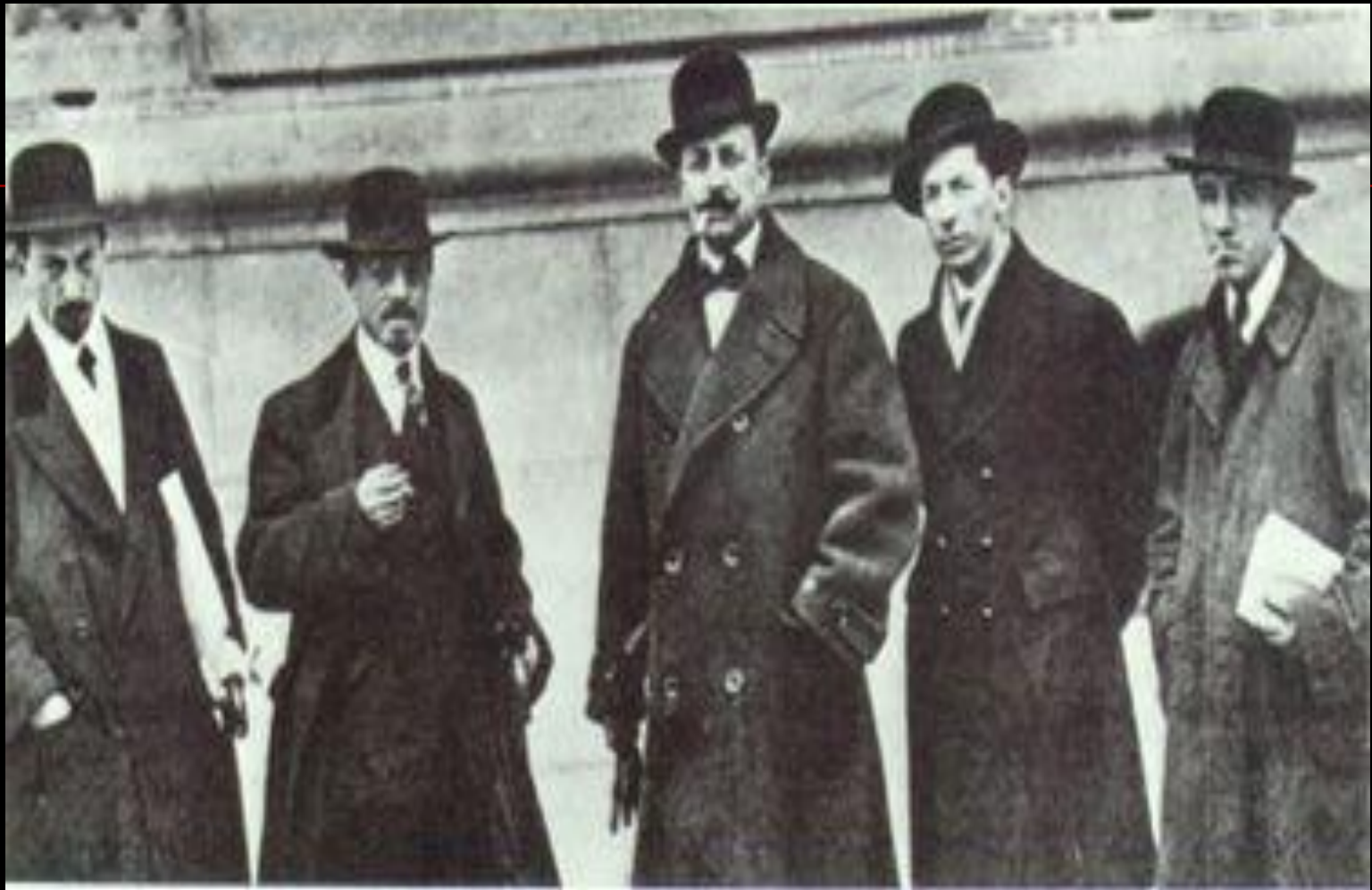
Carrà, Russolo, Marinetti, Boccioni e Severini.