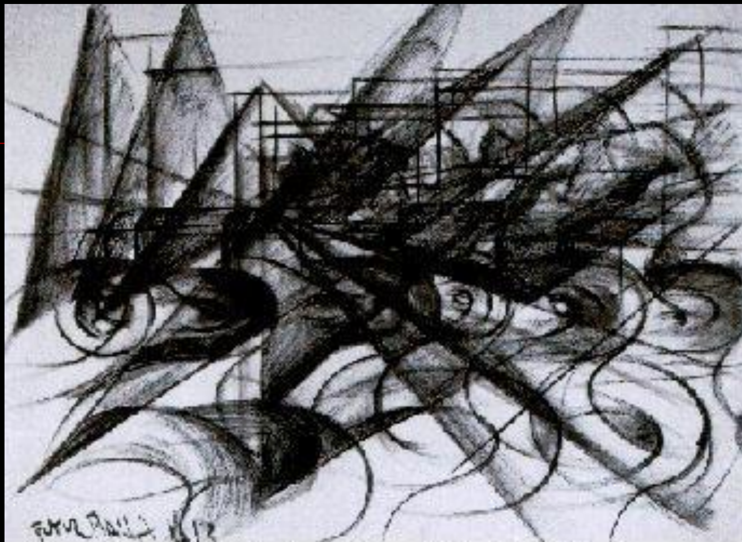
Automóvel + velocidade + luz, Giacomo Balla, Col. Particular